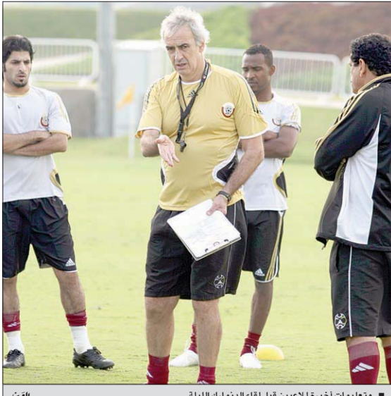
تعليمات أخيرة للاعبين قبل لقاء الدنمارك الليلة